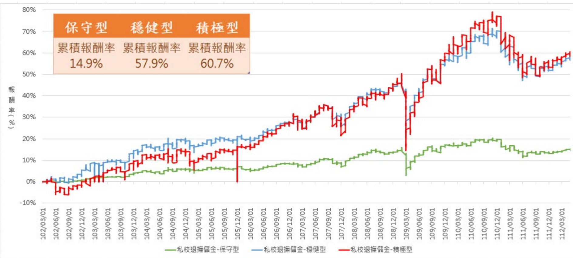
102/3/26成立至112/5/31累積報酬率走勢圖