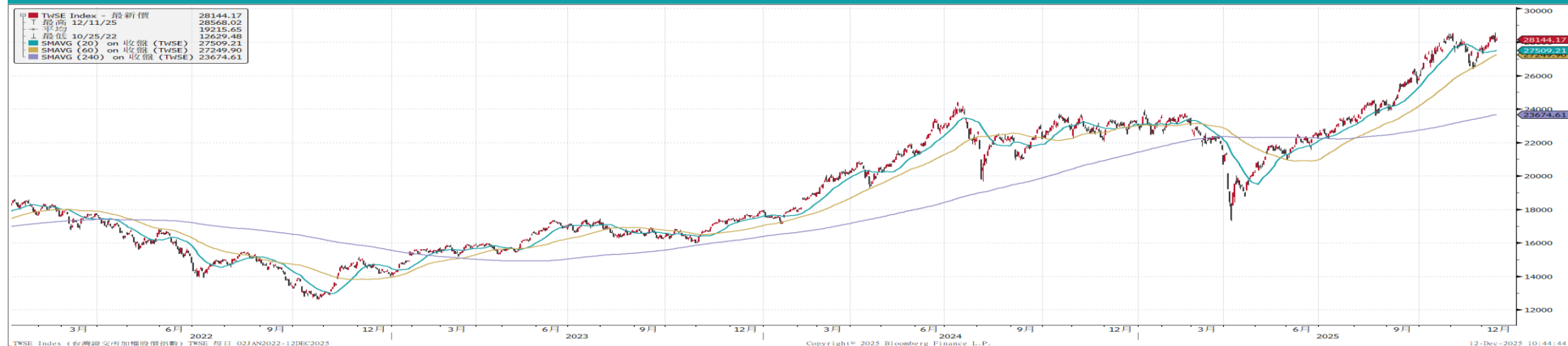
台灣加權指數走勢