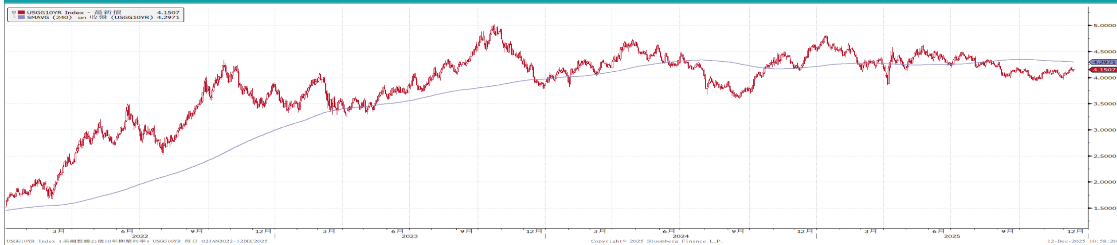
美國10年期公債殖利率