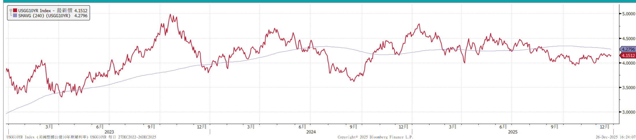
美國10年期公債殖利率