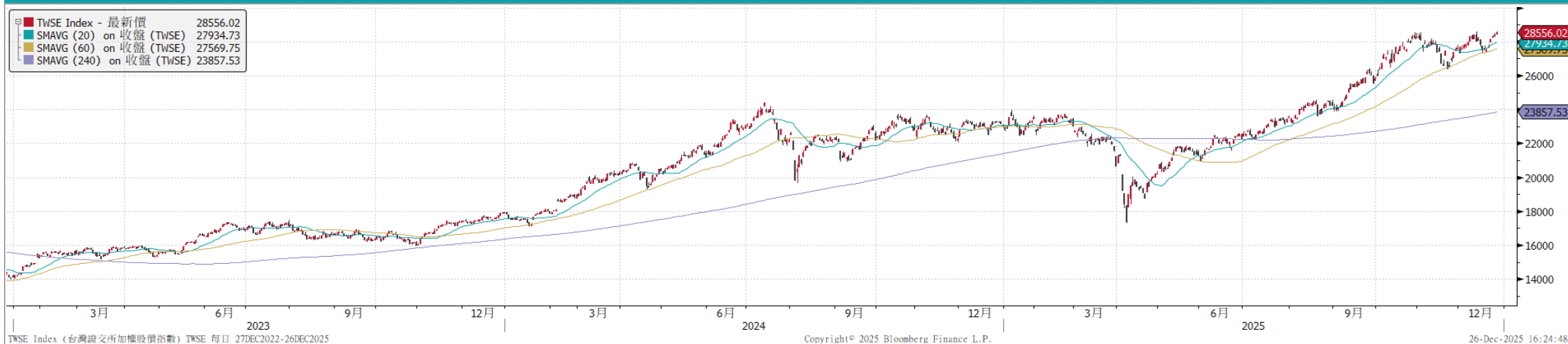
台灣加權指數走勢