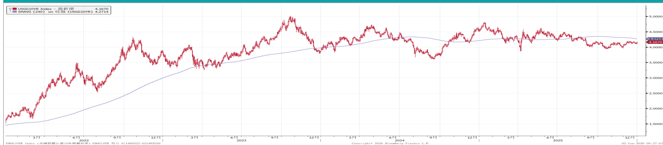
美國10年期公債殖利率