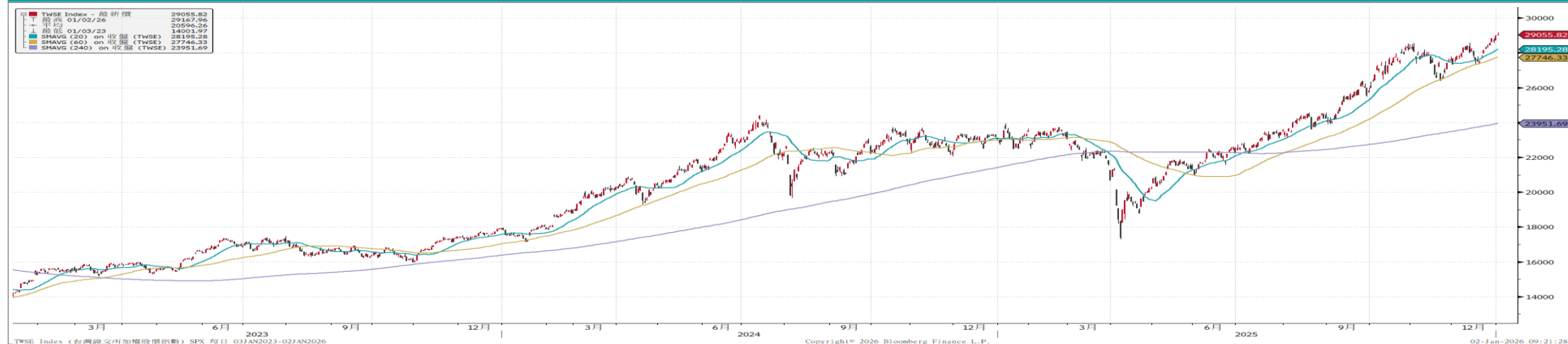
台灣加權指數走勢