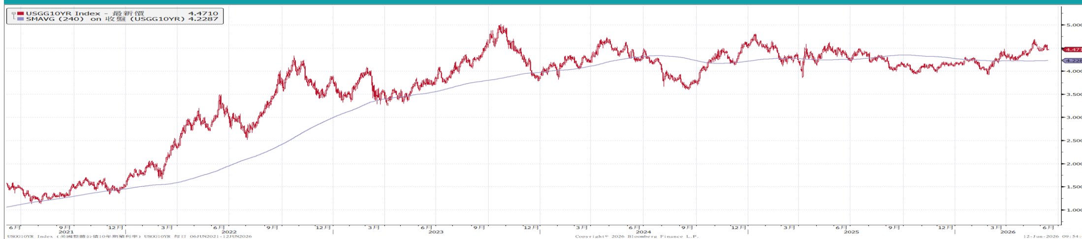
美國10年期公債殖利率