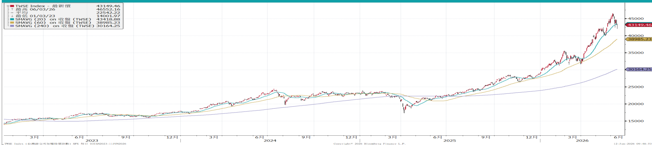
台灣加權指數走勢