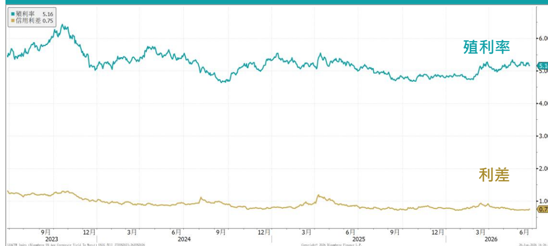
美國非投資級企業債利率與利差走勢