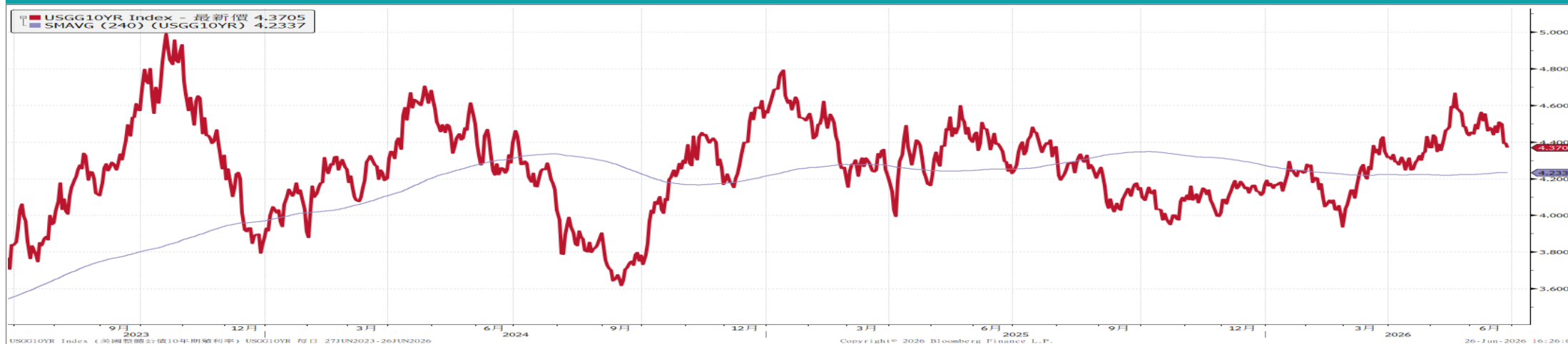
美國10年期公債殖利率