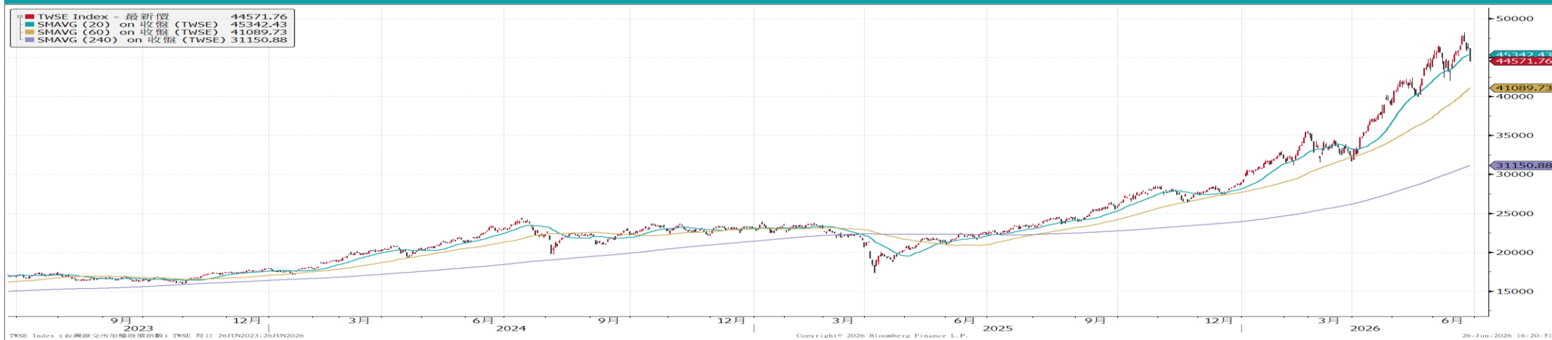
台灣加權指數走勢